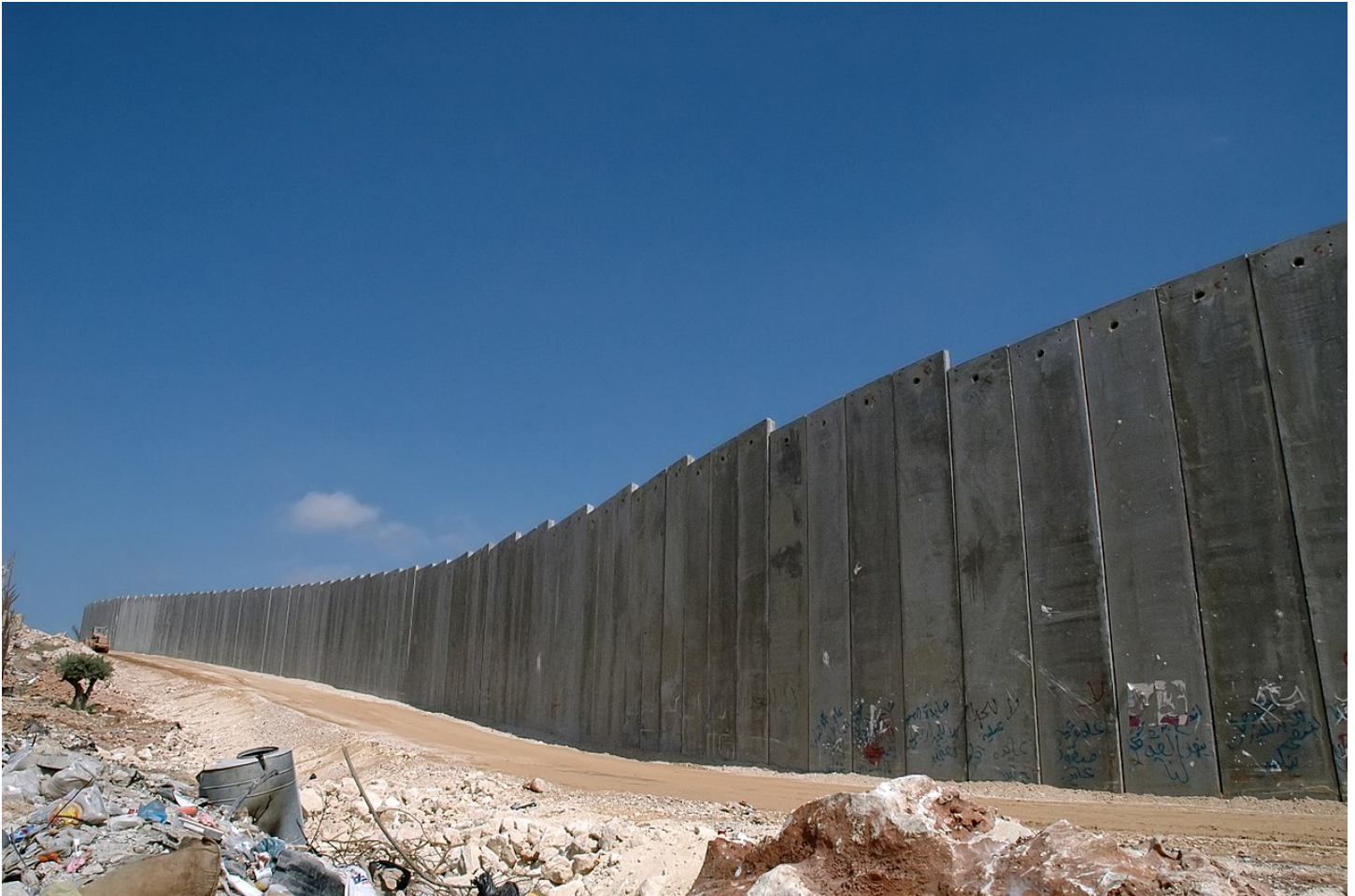
En del av barriären på Västbanken.