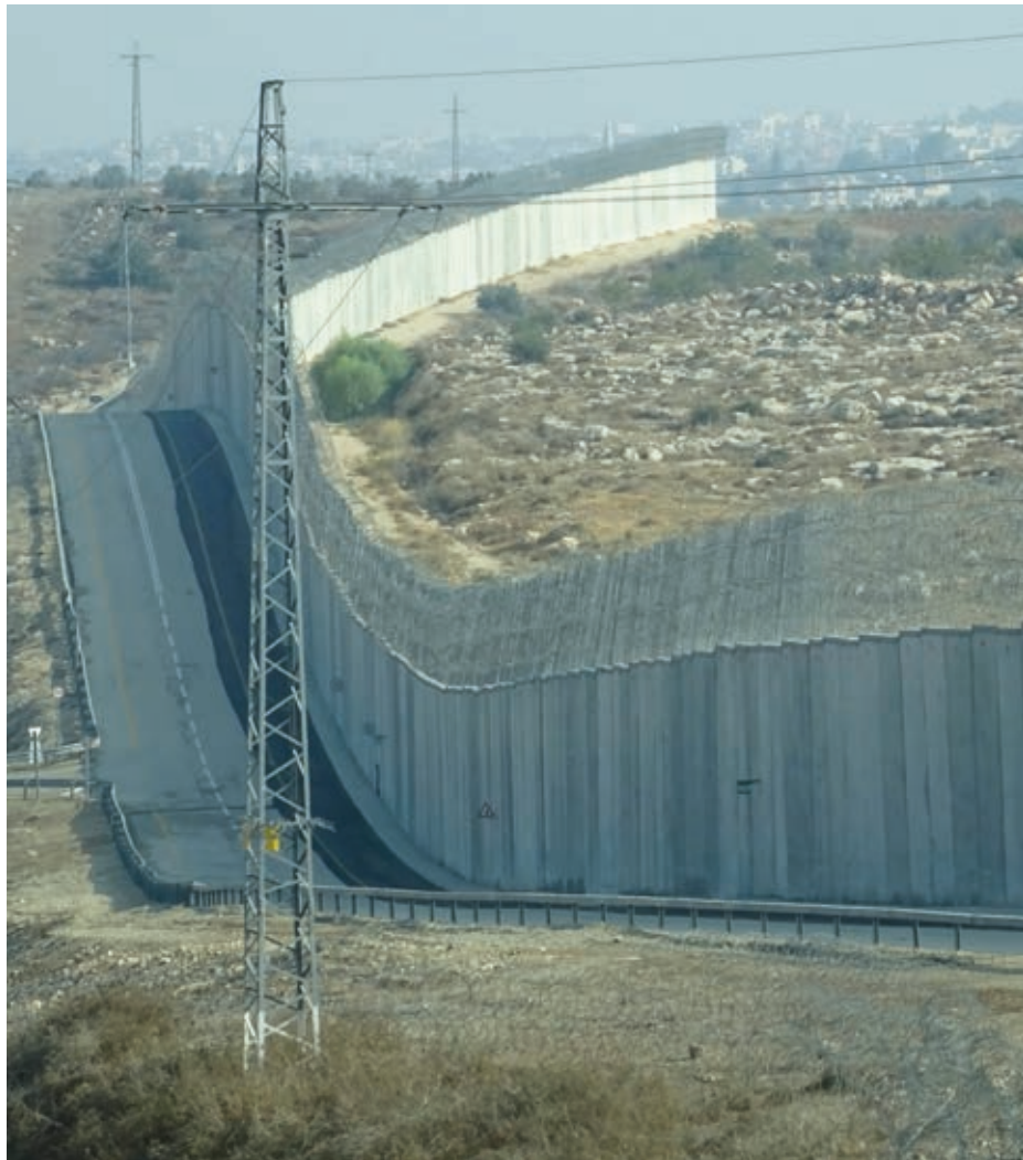
Efter många års besök i Israel och Palestina utkommer nu "I skuggan av muren", en essä- och reportagebok av Stefano Foconi och Tomas Andersson. Här en bild ur boken, av muren mellan Israel och Västbanken, sydväst om Hebron.

En god regel i all argumentation är den som lånas från ekvationens värld: Det du gör på ena sidan av lik-